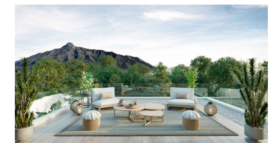
Imágenes y planos orientativos sujetos a realización de proyecto | Illustrative pictures and plans subject to project execution