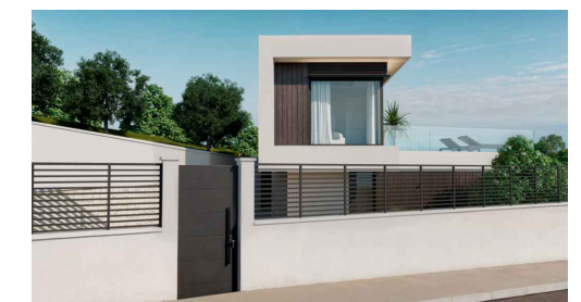
Imágenes y planos orientativos sujetos a realización de proyecto | Illustrative pictures and plans subject to project execution