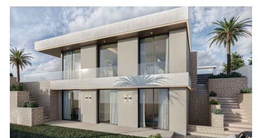
Imágenes y planos orientativos sujetos a realización de proyecto | Illustrative pictures and plans subject to project execution