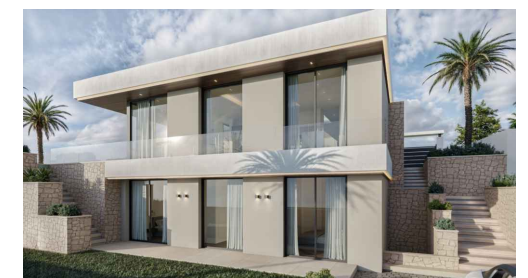
Imágenes y planos orientativos sujetos a realización de proyecto | Illustrative pictures and plans subject to project execution