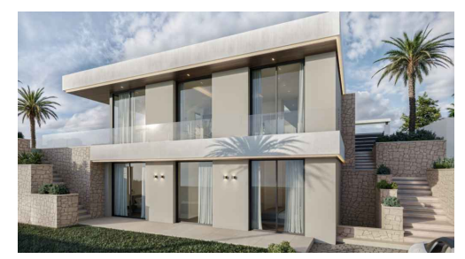
Imágenes y planos orientativos sujetos a realización de proyecto | Illustrative pictures and plans subject to project execution