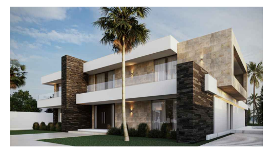
Imágenes y planos orientativos sujetos a realización de proyecto | Illustrative pictures and plans subject to project execution