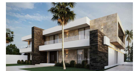
Imágenes y planos orientativos sujetos a realización de proyecto | Illustrative pictures and plans subject to project execution