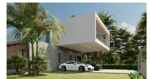
Imágenes y planos orientativos sujetos a realización de proyecto | Illustrative pictures and plans subject to project execution